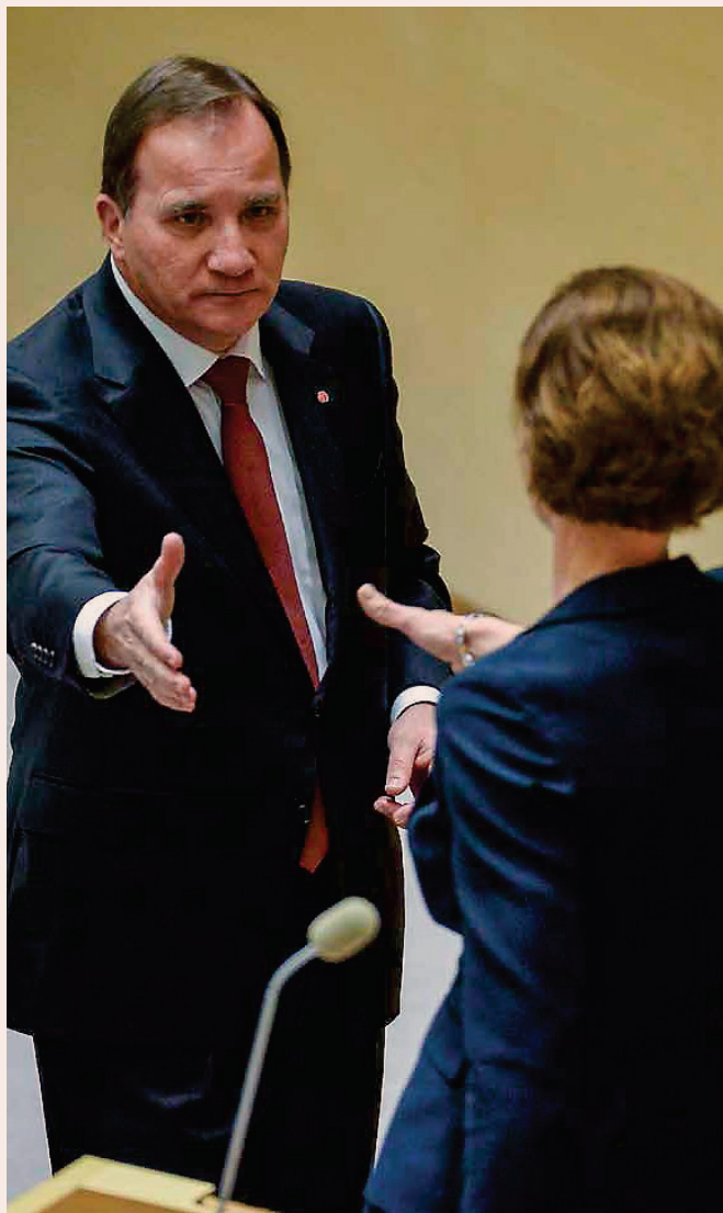
BORDE SAMARBETA. 28 procent av de tillfrågade vd:arna vill se Socialdemokraterna och Moderaterna i en regeringskonstellation.

AFRODITI KELLBERG afroditi.kellberg@di.se 08-573 651 22