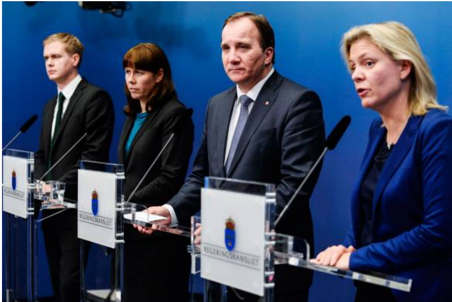
ORSAK TILL ORO. Den rödgröna regeringen, med skolminister Gustav Fridolin (MP), miljöminister Åsa Romson (MP), statsminister Stefan Löfven (S), och finansminister Magdalena Andersson (S), är en av anledningarna till att storföretagens ledare tappar investeringslusten.